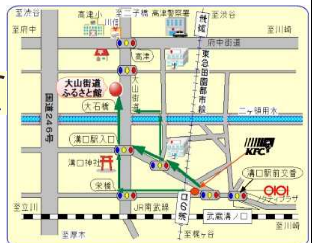
—ふるさと館案内図—

JR南武線 武蔵溝ノ口駅 下車 徒歩7分 東急田園都市線 高津駅 下車 徒歩5分