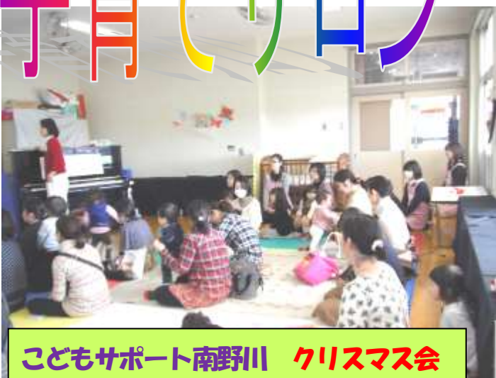
こどもサポート南野川 クリスマス会