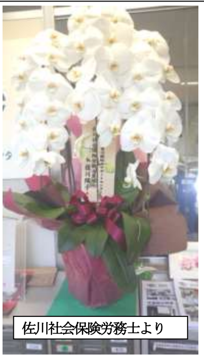
佐川社会保険労務士より

平成27年7月10日付けて認定申請 のありました特定非営利活動法人つ いては、次の期間を有効期間として認 定しましたので、特定非営利活動促進 法第49条第1項の規定により通知し ます。